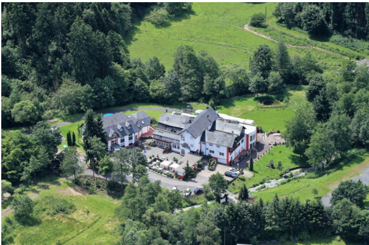
Die Studentenmühle Nomborn, www.hotel-studentenmuehle.de

LANDHOTEL STUDENTENMÜHLE IN NOMBORN, NÄHE MONTABAUER